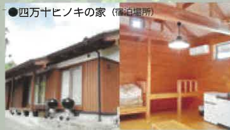
●四万十ヒノキの家(宿泊場所)