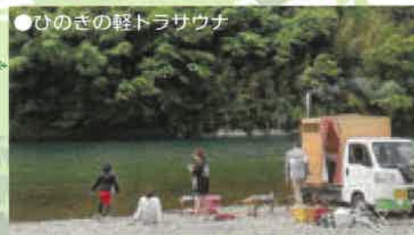
●ひのきの軽トラサウナ