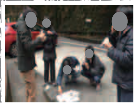
腹が減っては冒険はできぬ

洞窟内に潜入。全長800mさらに案内図を見ると道がかなり入り組んでいてなかなか険しい冒険になりそうです。道幅が狭く、頭の高さに岩がせり出して、高低差の激しい階段があり、みんな1列になり、慎重に進みます。