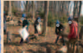
分担して作業してます