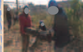
丸太を運んでます