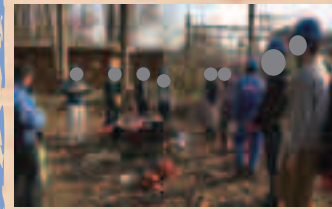
説明を受けてます

拝島駅近くの日光橋公園の保全活動ボランティアを行いました。当日は天気がよく、ぽかぽか春の陽気。そばには小川が流れていて散歩するには絶好の綺麗な公園でした。さて私たちがする作業は、専門作業員の方が切り倒した丸太をひたすら運ぶというものです。木が風で倒れて付近の線路を妨害しないようにと木を切るようです。専門作業員の方から説明を受けた後、作業に取りかかります。やったことある方は分かるかもしれませんが、丸太って見た目より重いんですね。いける!と思っても持てなかつたり。みんな持ち方を工夫したり、複数人で運んだり、転がしたり。なんとか終わった!!と思ったのも束の間、次はあちらをお願いしますと専門作業員の方、曰く。みんな汗だくで、完全にペー配分間違えたと漏らす者も。終わったと思ったら次の所というのを2〜3回繰り返して、ようやく終了。いや、体力勝負でしたね!お疲れ様でした!! 帰りみち、小川スタッフからみんなにジュースが振るまわれ労働のあとのジュースは、何気なく飲むジュースの何倍もおいしいことを発見した、そんな1日でした。