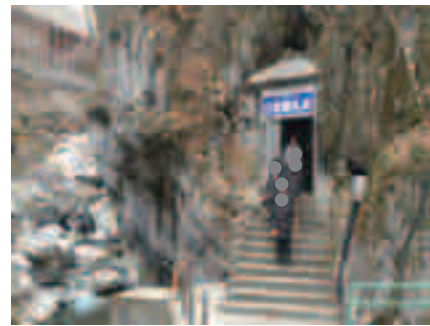
洞窟入り口。 みんな面白い並び方ですね

2/24(水)、奥多摩にある 日原鍾乳洞 に行ってきました。センターを車で出発して1時間半ほどで到着。ときどき雪の舞う寒空の下で、みんなで作ったおにぎりを食べました。山の新鮮な空気と川のせせらぎ。