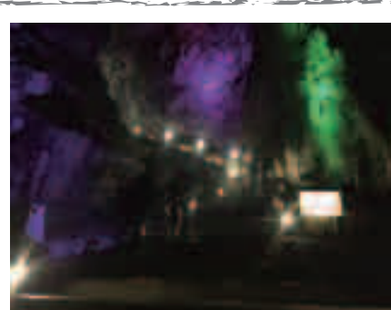
幻想的な空間が広がっています

紫や赤、青、黄。色彩豊かなライトアップも相まって、洞窟内はRPGゲームの世界のような雰囲気でした。(さすがに モンスター までは出てきませんでした)