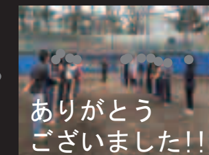
ありがとう ございました!!