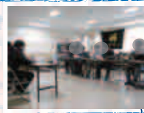
はじめまして よろしく!!