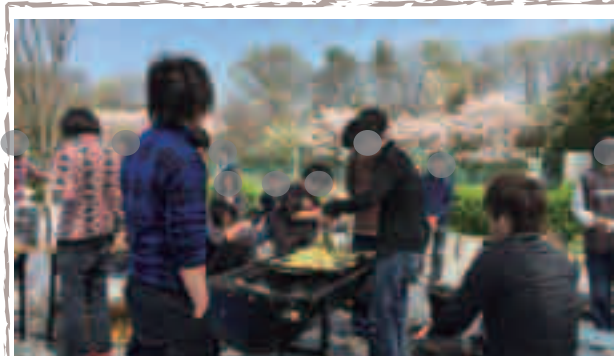
焼き係さん、おいしいお肉お願いしますよ

朝10時に乾杯をし、スタート。BBQは他の イベントでもやっていたりするので、もう 手馴れたものです。12期生も積極的に調理 に参加してくれました。肉、野菜そしてシ メの焼そば。あっという間に完食とな りました。みんなお腹いっぱい食べられた でしょうか？