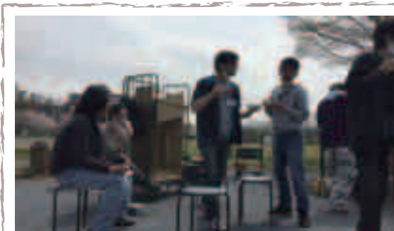
どんな話に花が咲いているのかな？