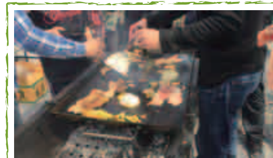
やっぱり花より団子(肉)かな？