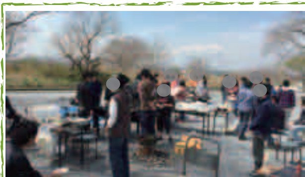
桜もちょうどよい咲き加減

春 が来～た、春が来～た♪ど～こ～に 来た～♪ここに来たんですね～。4/6(水)、 福生南公園に花見をしにいってきました。 みんなの普段の行いが良いせいか天気も晴 れ、気温もちょうどよく花見日和でした。 新しく入った合宿12期生にとっては初のイ ベント。さらに、ジョブスペース、多摩サ ポステのメンバーも加わり、総勢60人と にぎやかな花見になりました。