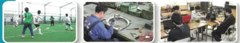
※合宿中は、スタッフ、利用者全員が、検温、手指消毒、マスク着用、蜜を避ける行動を厳守しています。