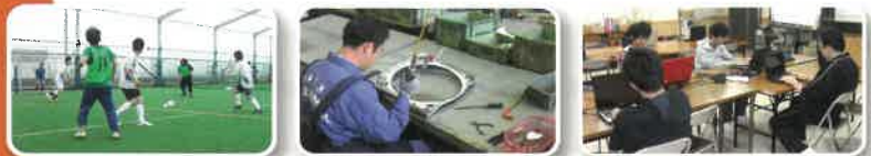
※合宿中は、スタッフ、利用者全員が、検温、手指消毒、マスク着用、密を避ける行動を厳守しています。