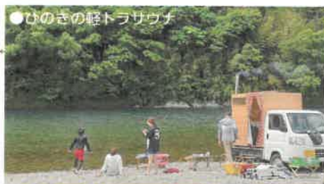
●ひのきの軽トラサウナ