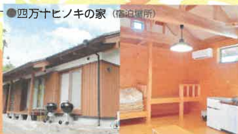
●四万十ヒノキの家(宿泊場所)