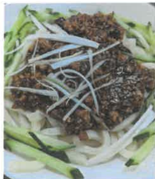
↑とある土日のランチメニュー。麺類がよくです。